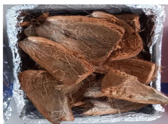
Gambar 1. Sabut Kelapa

analisis dalam mengidentifikasi sampel yang memiliki titik didih tinggi dan memiliki polaritas yang tinggi serta mengandung senyawa yang bersifat non volatil yang tidak dapat diidentifikasi melalui GCMS konvensional [6]. Metode ini dapat memberikan petunjuk tentang komposisi kimia produk pirolisis yang dihasilkan hanya dengan menggunakan sampel yang sangat sedikit (<2 mg). Py-GC/MS memiliki kelebihan dibandingkan dengan GC/MS konvensional yaitu Py-GC/MS dapat mengidentifikasi senyawa yang memiliki titik didih dan polaritas yang tinggi seperti senyawa asam karboksilat, alkohol dan fenol. Selain itu, Py-GC/MS mampu memberikan deskripsi kimia secara lengkap tentang berbagai jenis komponen biomassa dan biopolymer kompleks seperti alga, karbohidrat, asam amino dan lignin. Analisis bio-oil atau biomassa dengan Py-GC/MS dapat dilakukan secara langsung tanpa preparasi khusus [7].