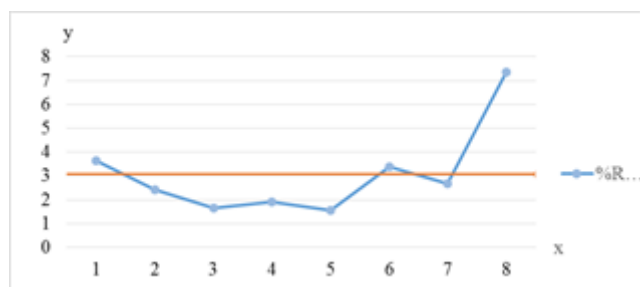
Gambar 2. Bagan Kendali Presisi (%RPD) MBAS Secara Spektrofotometri UV-Vis

Berdasarkan data dan bagan kendali yang ditunjukkan pada gambar 2, dapat disimpulkan bahwa tidak ada data di luar batas peringatan atas/bawah ( \pm 3SD ) atau outliner dan tidak ada data yang menunjukkan kecenderungan [12].