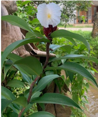
Gambar 1. Bunga Pacing Putih.

pacing putih mengandung senyawa alkaloid, flavonoid, polifenolat, kuinon, tanin, saponin dan monoterpen/seskuiterpen. Penelitian oleh Rahmiyani & Zustaka (2016) juga melaporkan adanya kandungan senyawa metabolit sekunder pada ekstrak n-heksana, etil asetat dan metanol daun pacing yakni senyawa alkaloid, flavonoid, polifenol, steroid, mono dan seskuiterpenoid, kuinon. Hasil penelitian Fifendy et al. (2016) menunjukkan ketiga isolat cendawan endofit dari daun pacing putih memiliki potensi sebagai agen antibakteri berdasarkan kemampuannya menghambat pertumbuhan bakteri. Penelitian ini bertujuan untuk mengetahui aktivitas antibakteri pada ekstrak bunga pacing putih terhadap pertumbuhan E. coli serta diharapkan penelitian ini dapat menjelaskan manfaat alami dari bunga tanaman pacing putih dan dapat dijadikan sebagai dasar untuk penelitian selanjutnya terkait pemanfaatan tanaman pacing putih khususnya pada bidang kesehatan.