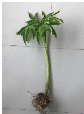
Gambar 1. Umbi Porang

diposisikan di persimpangan tengah setiap tangkai dan cabang selebaran [16]. Tanaman umbi porang disajikan pada Gambar 1 :